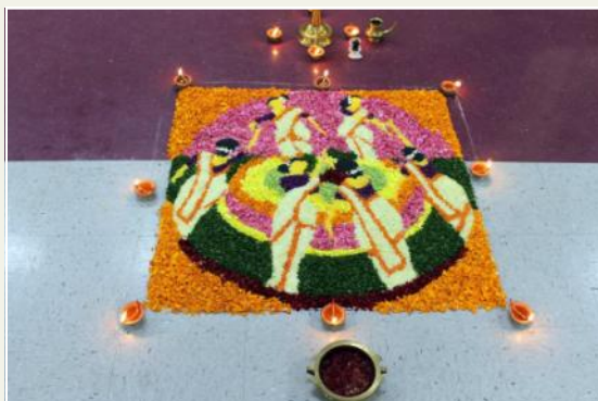
1st Prize—Cypress Team

The Pookkalam competitions were organized as part of the Onam theme for our cultural fest celebrations on Oct 8, 2016. Five teams representing various areas of Houston participated in the competitions. The teams were free to use flowers, fruits, vegetables, leaves, and grains etc, all which are natural. Evaluation criteria was creativity, presentation and neatness. There was much excitement and healthy spirits amongst the teams as each team worked within their 1 hour time limit to present their best creation. The results were spectacular!