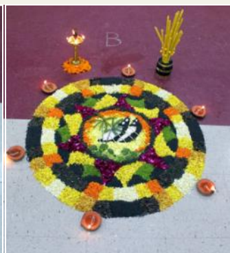
2nd Prize - Sugar Land Team 1