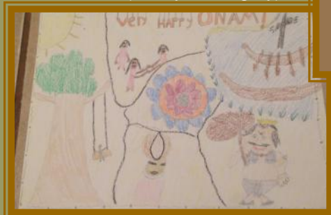
Sanat Nair 2nd Place (11-15 yrs category)