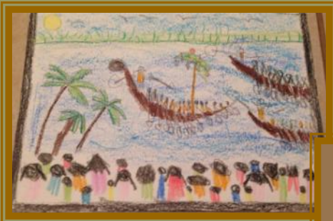
Mahadev Nair 2nd Place (5-10 yrs category)