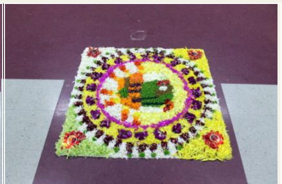
3rd Prize - Woodlands Team