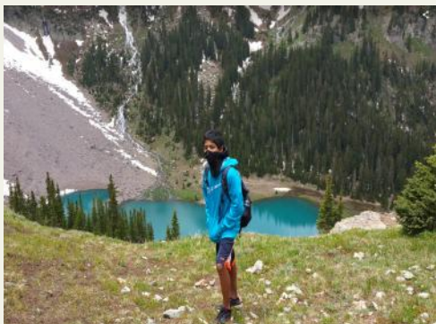
The lake was literally the shade of my hoodie!

After resting for a few minutes and appreciating the beauty of the lake, we set out to find the trailhead to the second blue lake. We found it, but then we realized we had to again cross a river-- technically the same river. The trail was considerably long after we crossed the river. A quick education on the difference between a hike and a climb. Hike is basically walking while climbing involves using your legs and hands on a vertical rock face up. Okay, back to the story. After we climbed a rock face we hiked on and to our surprise --- snow!!!. Just in case you didn't realize this is in the middle of summer (July) in Colorado. This snow has changed to ice now and there is a high chance to slip and fall to God knows where!!! After we hiked for a few more minutes, we reached the second blue lake. This lake was a disappointment compared to the first blue lake. After a few minutes of rest we headed down to Ouray to hike a trail called the perimeter trail which was literally a trail that went