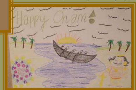
Nayanthara Thampan 3rd Place (11-15 yrs category)