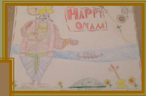
Evan Thekkal 2nd Place (11-15 yrs category)